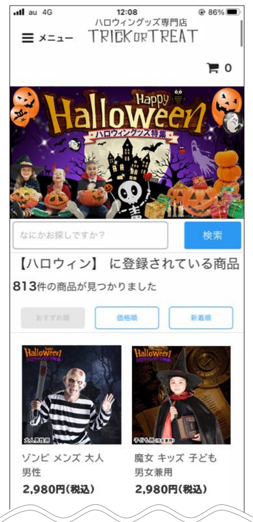
当社運営販売サイト(Trick or Treat)