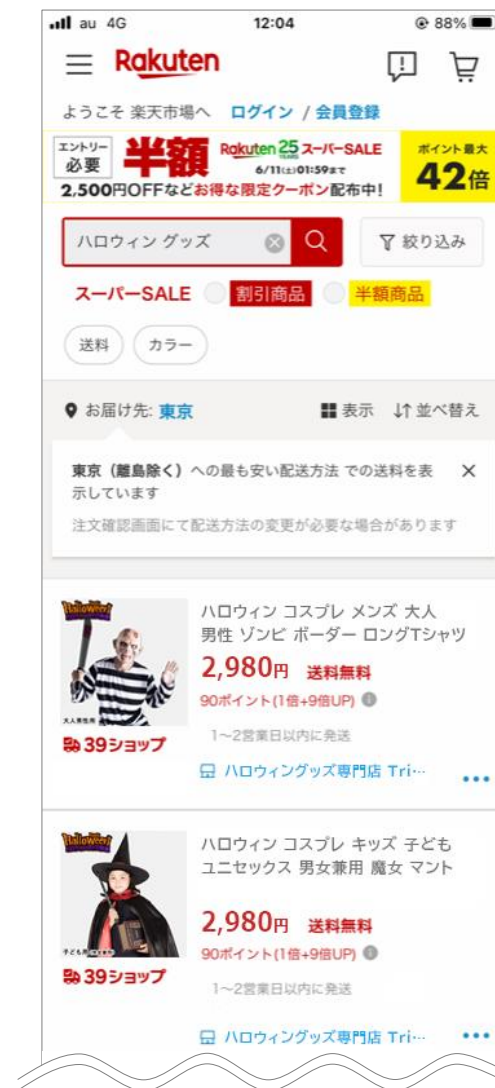
Trick or Treat 楽天市場店